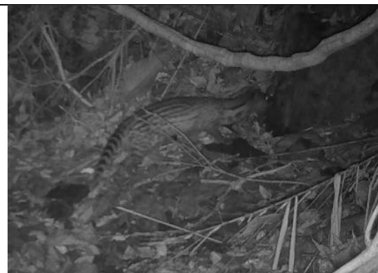
麝香貓(第二級保育類)