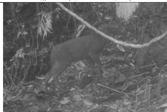
台灣長鬃山羊(第三級保育類)