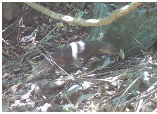
食蟹獾(第三級保育類)