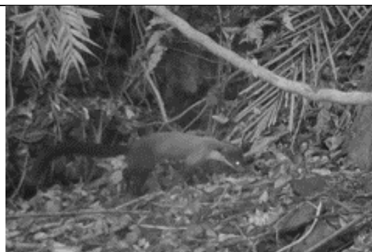
黃喉貂(第三級保育類)