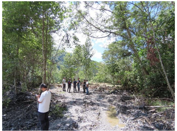
災害照片 8.4K上邊坡崩塌情形