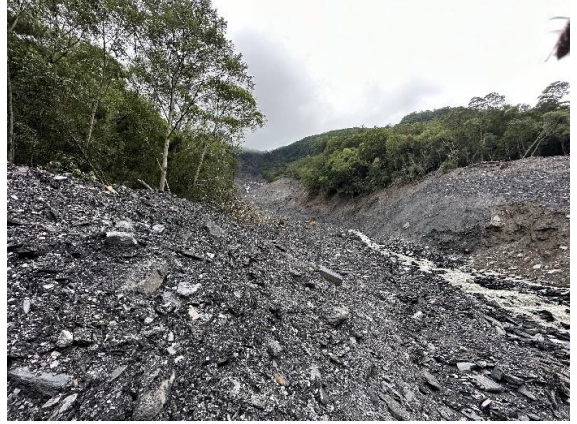
災害照片 8.4K上邊坡崩塌情形