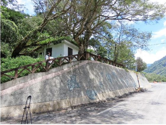
災害照片 轉彎段既有房舍及大樹