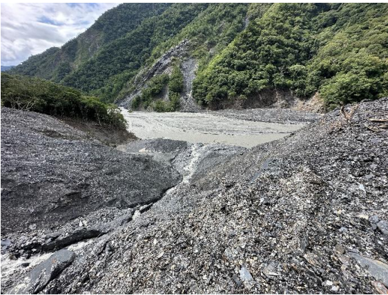
災害照片 8.4K下邊坡土石流失情形