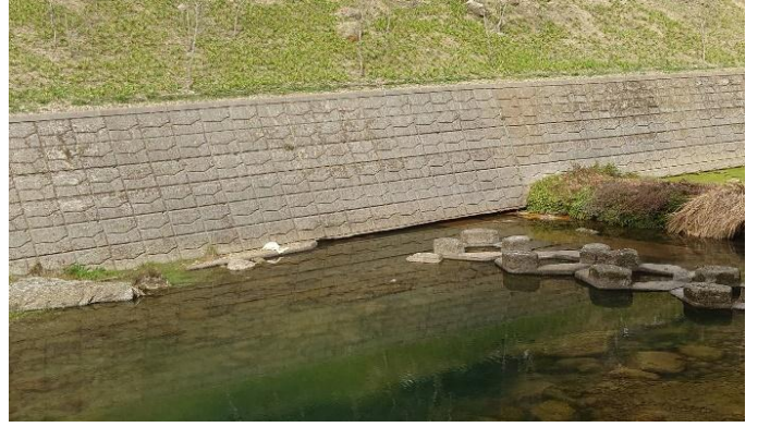
災害照片 上游結構基礎掏空