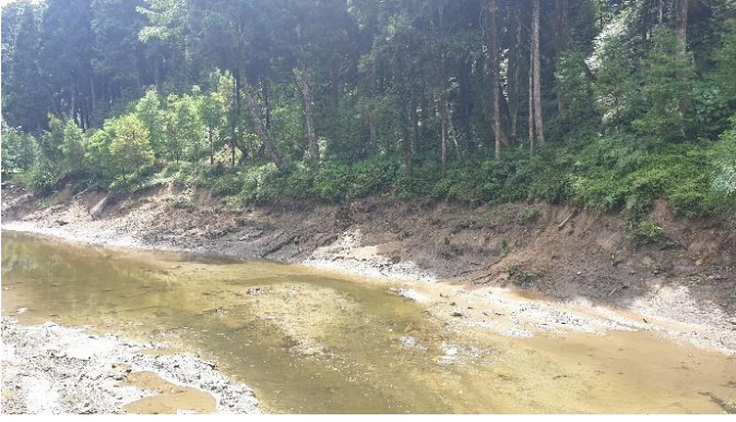
災害照片 左岸無護岸保護坡址