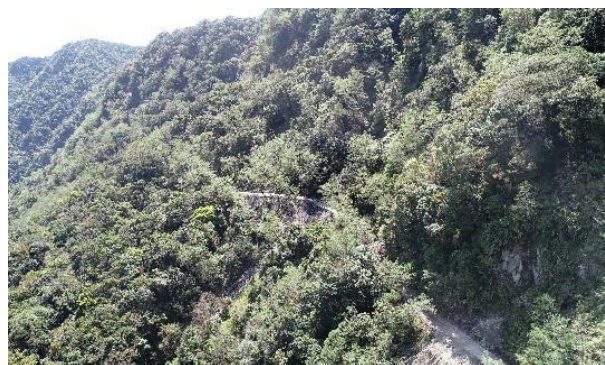
利嘉林道沿線共可見四種植被類型， 包含台灣赤楊林、原始林、岩生植被 及崩塌地植被 拍攝日期：112/3/23