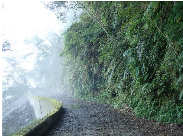
林道上邊坡岩壁之岩生植被 拍攝日期：112/11/09