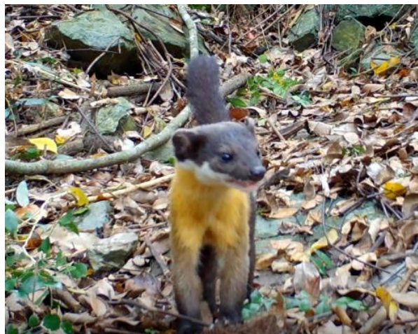
黃喉貂(第三級保育類)