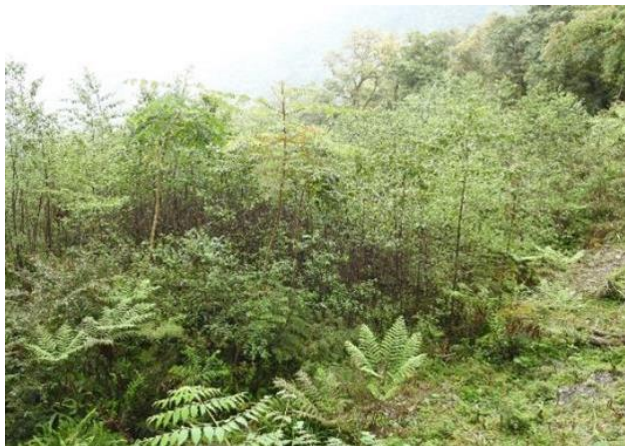
崩塌後形成之台灣赤楊林 拍攝日期：112/3/28