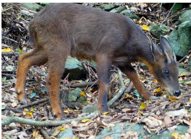
台灣野山羊(第三級保育類)