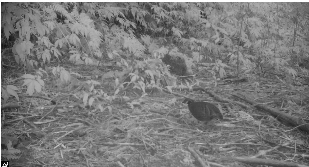
深山竹雞(台灣山鷓鴣；第三級保育類)， 會在夜間停棲於林道兩側的灌木或是喬木上睡覺。